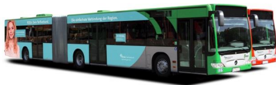
Bildunterschrift: Die Busse des SVHIs und RVHIs werden für den neuen Tarifverbund werben.