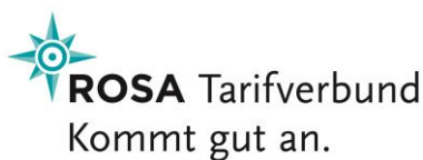
Bildunterschrift: Logo des ROSATarifverbundes